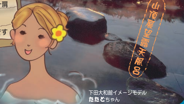
下田大和館イメージモデル たただちゃん